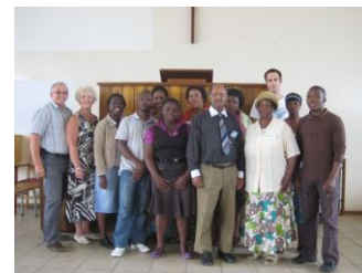
Het team van Qwa-Qwa

De week voor mijn verlofperiode in Nederland vond de training van trainers plaats, hier in Phuthaditjhaba. Met als doel om een lokaal ontwikkelingsteam te trainen. De training nam vier volle dagen in beslag, vrij intensief dus! De training verliep voorspoedig, de groep groeide naar elkaar toe en pikte het concept goed op. Het concept waarin zij de eigenaars zijn van het programma en wij van C-A-N als externe ondersteuning aanwezig zijn. Nu na een paar weken blijken er wat opstartproblemen te zijn. Op dit moment ben ik bezig om te luisteren naar het team. Dit gaat tegen mijn eerste reactie in, graag zou ik willen 'doen' en het programma lopende hebben. Maar zien jullie het verschil? Dan ben ik de eigenaar en niet zij. Wil je aan mij en het team denken en bidden voor wijsheid in dit proces?