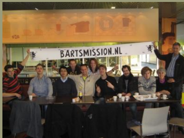
Welkomst comité op Schiphol