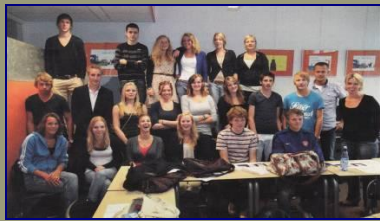
Studenten van het ROC-Groningen