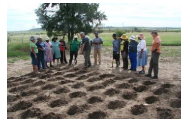
Training foundations for farming

mens in God gelooft en erkend dat Jezus op deze aarde leefde, hier gestorven is en weer opgestaan is ondergaat hij/zij een hartsverandering. Geen egoïsme meer, maar geven i.p.v. nemen. Iedereen kan een god aanbidden en denken door goed te doen onszelf te verrijken, zelfs zonder een god te dienen kunnen wij ons op die manier goed voelen. Geen verschil onder welk etiket je dan gelooft (of juist niet gelooft). Een leegte blijft, een vraag naar wie je bent. Tot die vraag beantwoord is blijven wij (ten diepste) op onszelf gericht. Een verandering treed op wanneer je erkent dat God de wereld zo lief heeft dat Hij Zijn Zoon gegeven heeft om voor ons te sterven, opdat wie daarin gelooft eeuwig leeft.