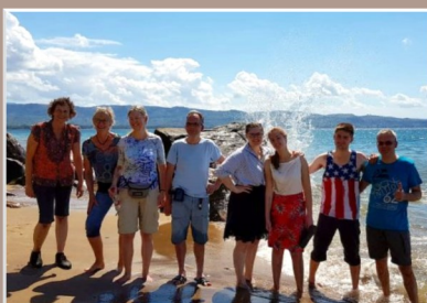
Haulerwijkers in Malawi