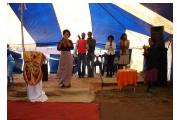
De grote blauw witte tent