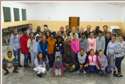
DMT-groep & Schlip tieners