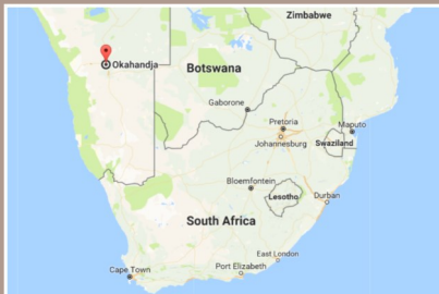
Hier zijn wij