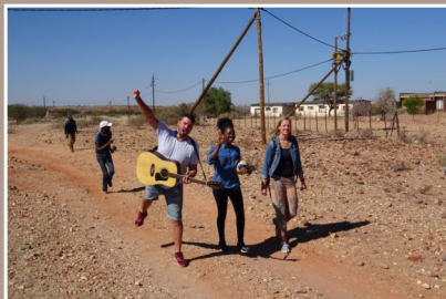
Onderweg naar een school