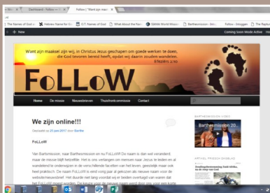
De nieuwe website